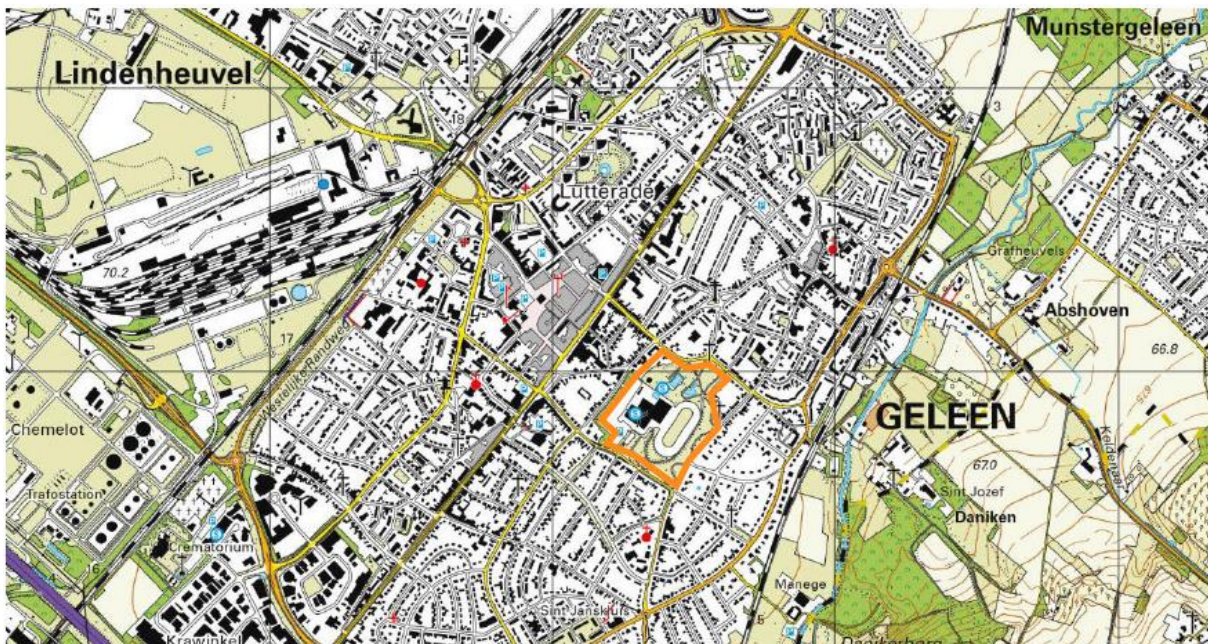
Uitsnede topografische kaart met ligging plangebied (oranje omlijnd)

Het plangebied is gelegen tussen de Parklaan en Irenelaan in het oosten van Geleen. De kavels 4439, 4440 en 4326 vormen het plangebied dat volledig in eigendom is van de Gemeente Sittard-Geleen. Op de onderstaande topografische kaart is de ligging van het plangebied globaal weergegeven.