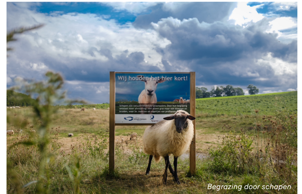
Begrazing door schapen