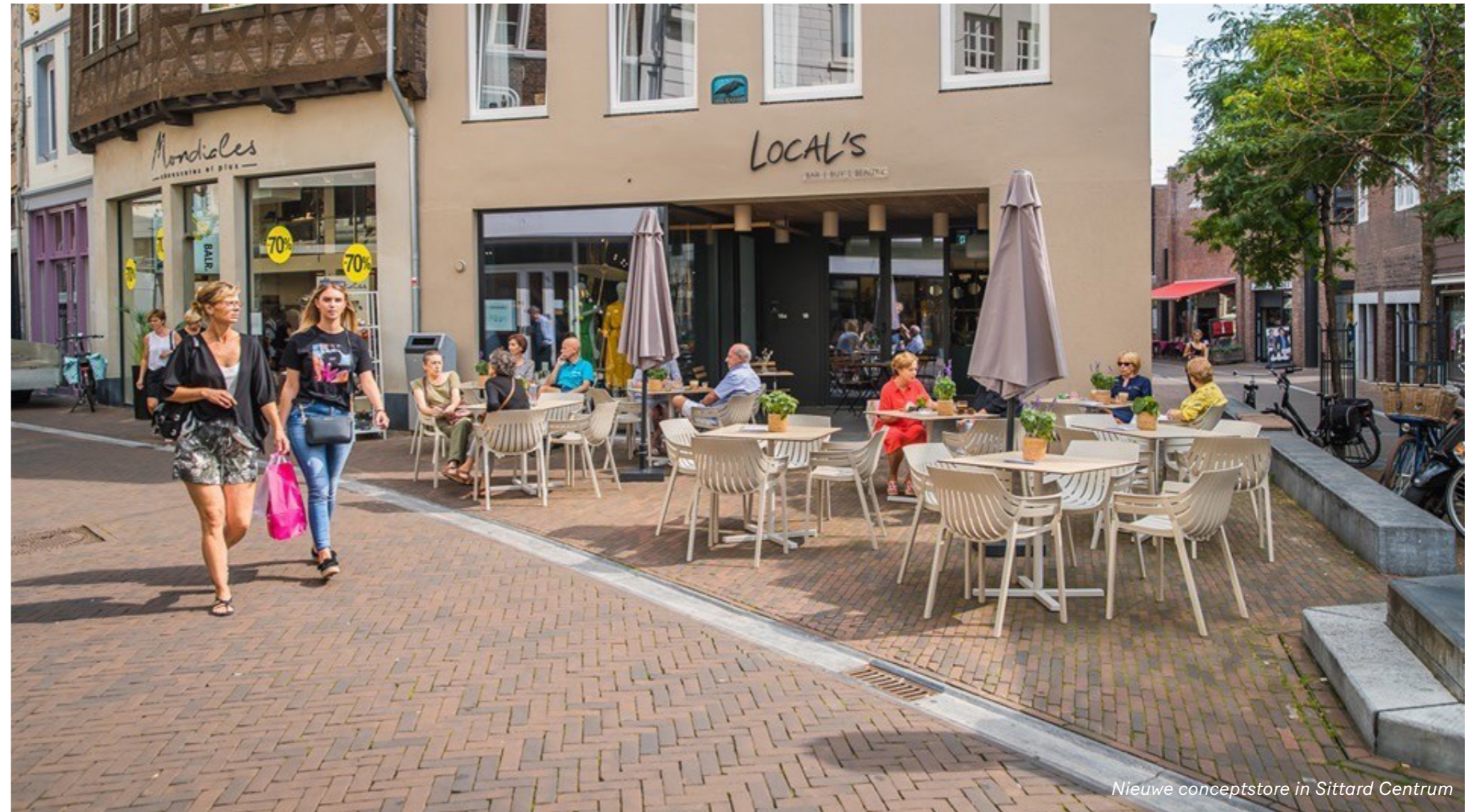
Nieuwe conceptstore in Sittard Centrum