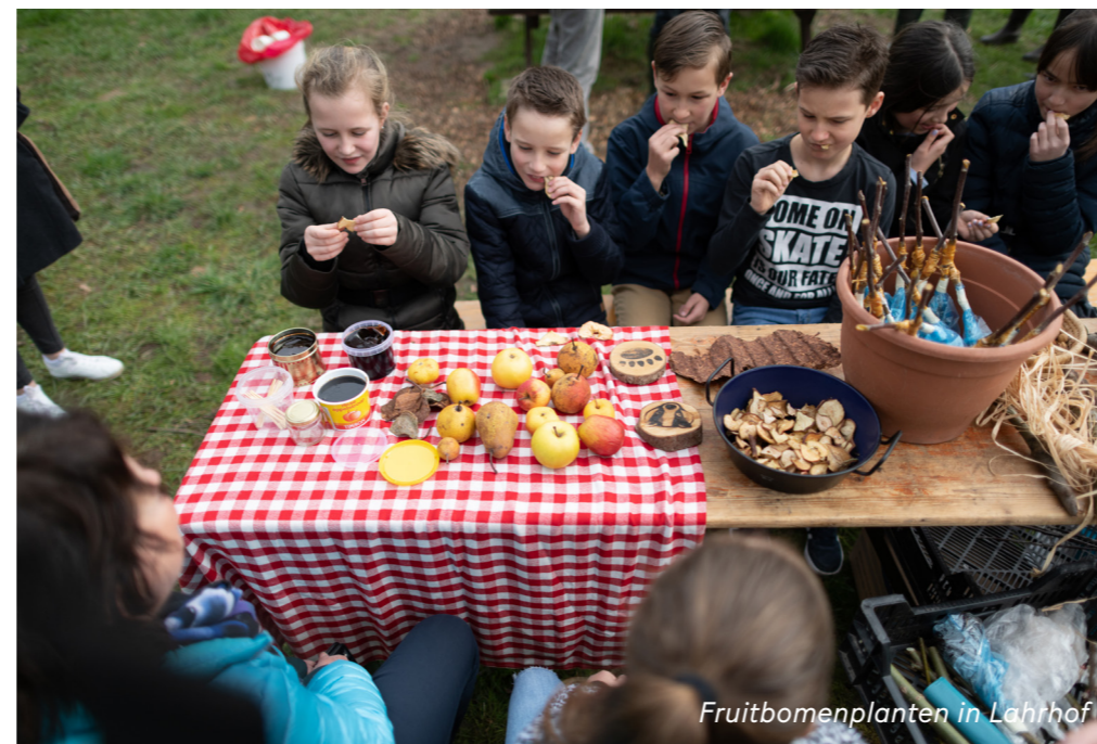
Fruitbomenplanten in Lahlhof