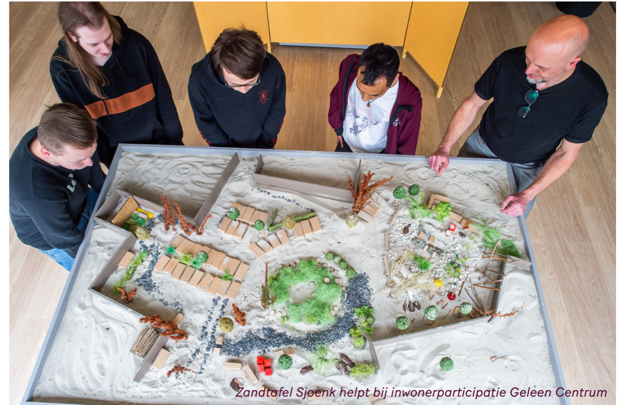
Zandtafel Sjoenk helpt bij inwonerparticipatie Geleen Centrum