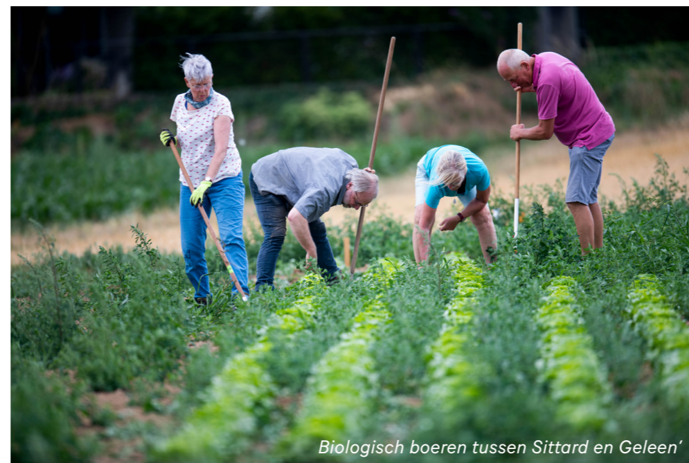
Biologisch boeren tussen Sittard en Geleen'